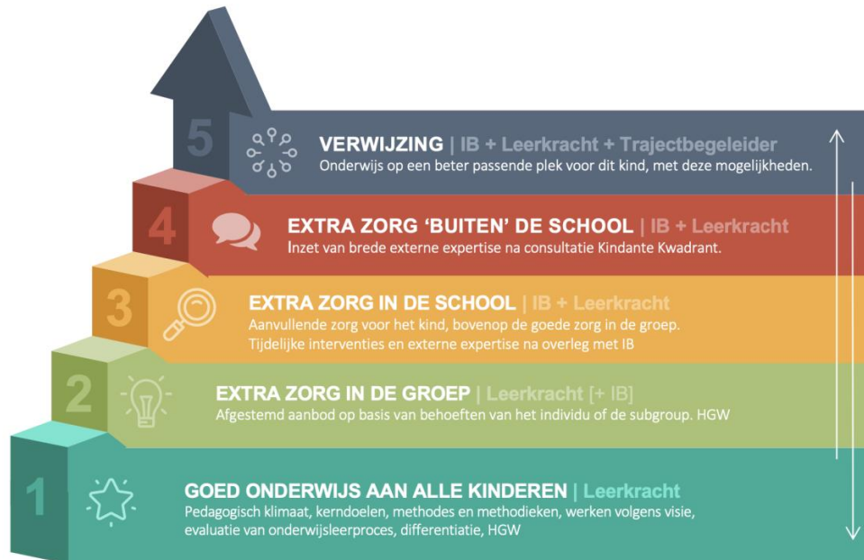
Figuur 1: Continuüm van Zorg

Basis van elke samenwerking binnen de school is het maken van goede samenwerkingsafspraken met externen over frequentie, tijdsduur en wijze waarop terugkoppeling naar school plaatsvindt. Via de volgende link meer info.